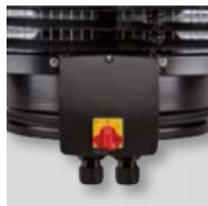
Werkschakelaar gemonteerd op de aansluitbox