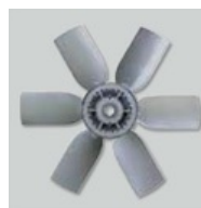
Dynamisch uitgebalanceerde waaier