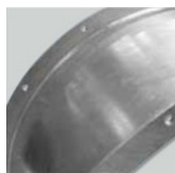
Beschermd tegen corrosie Behuizingen van gerold

Zeer veelzijdig assortiment dankzij het uiteenlopende aantal beschikbare bladen en verstelbare schoepoeken