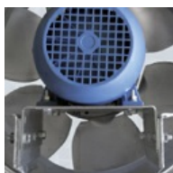
Motorsteun Vervaardigd van elektrogeplast plaatstaal.