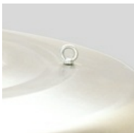
Eenvoudige installatie Voorzien van hijsogen