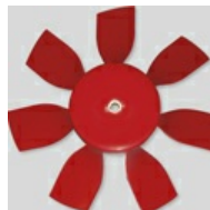
Dynamisch uitgebalanceerde waaier